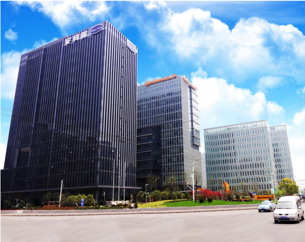
圖(2)為安莉芳上海總部外觀

安莉芳上海總部大廈，樓高 14 層，建築面積約 11,430 平方米，坐落於浦江畔、毗鄰北外灘，和陸家嘴金融中心隔江相望，日後定必成為該地區又一地標性建築。安莉芳集團這個最新的里程碑充分顯示了安莉芳逐步調整其大陸業務佈局，進一步鞏固其作為內地市場領導者的承諾和決心。